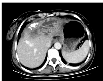
图1 上腹部增强CT影像

膈肌粘连组织送病理。冷冻石蜡常规报告: (膈肌)转移或浸润性腺癌, 行扩大左外叶切除+肝VIII段切除术。术后病理提示: 肝脏组织内见纤维增生, 黏液湖形成, 内漂浮异型腺上皮, 灶区见异型腺体, 浸润性生长(图2)。免疫组化(I20132103): CK7(+), CK20(+), Villin(+), CDX-2(-)。灶区示腺癌I~II级, 伴胆管扩张及肝内胆管结石, 结合免疫组化, 考虑原发于胆管。切缘未见癌组织。术后患者恢复可, 出院。