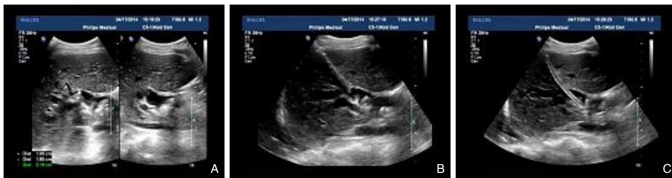
图 1 超声引导下建立引流及胆道镜取石通道 A: 术前超声显示靶点管及结石分布; B: 16 F 穿刺导管针一步法穿刺靶胆管; C: 置入 16 F 外导管建立通道

Figure 1 Establishment of the tract for drainage and stone removal under ultrasonic guidance A: Preoperative ultrasound showing the target bile duct and stone distribution; B: One-step puncture of the target bile duct using a 16 F catheter needle; C: Tract establishment by a 16 F outer catheter insertion