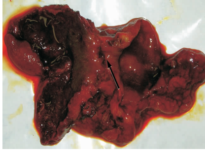
图2 胆囊术后解剖,中间可见小腔室,与前后两个较大胆囊腔室相通,小腔室内充满结石