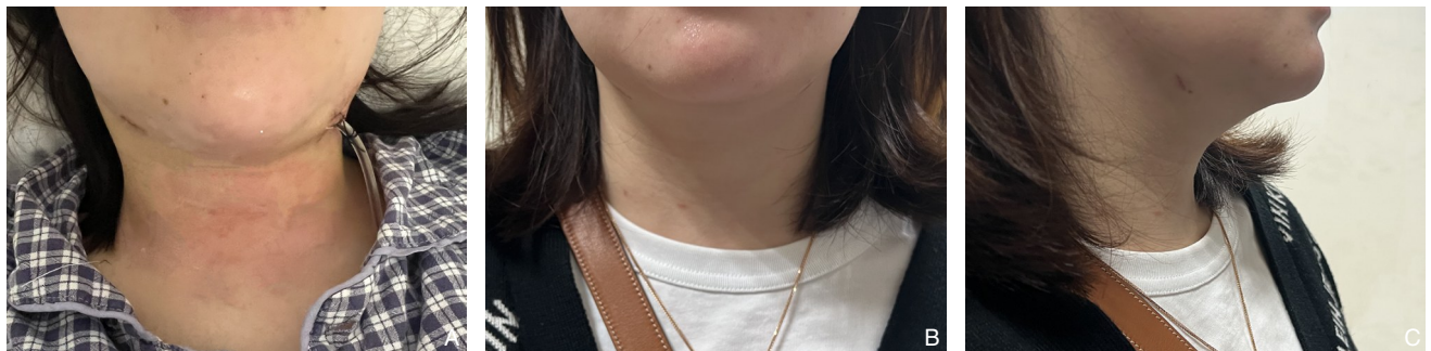
图2 患者术后伤口情况 A: 术后1 d颌下伤口情况; B-C: 术后30 d颌下伤口情况