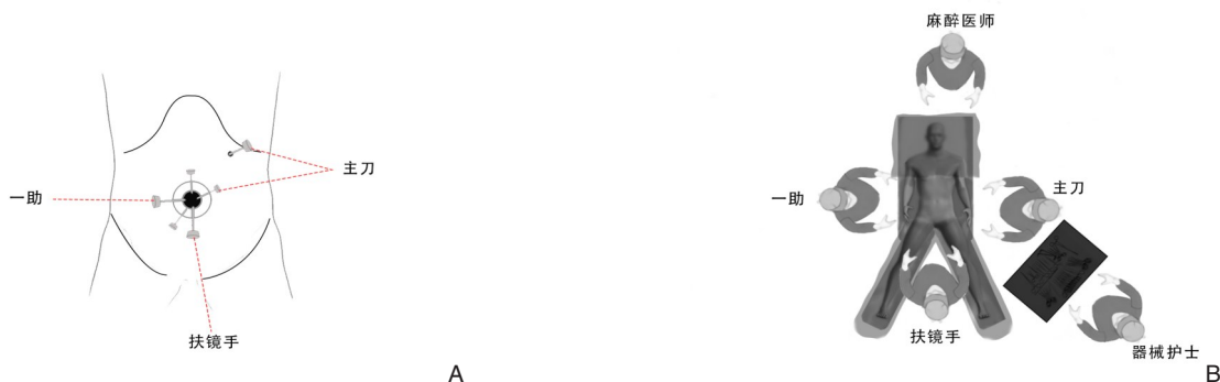
图2 术中Trocar布局与医护人员站位 A: 单孔+1布局; B: 外科医生、麻醉医生、器械护士站位

胆总管。经脐区纵切4 cm。然后, 将1个多通道单孔Trocar (北京航天卡迪科技研究院, 中国, 北京) 放进切口, 以2个5 mm通道和2个12 mm通道作为操作孔。为了提供更好的工作空间, 在左锁骨中线肋弓下3 cm处增设12 mm Trocar。单孔Trocar左侧12 mm通道和附加左肋缘下12 mm Trocar由主刀医生操作, 下方12 mm通道供扶镜手插入腹腔镜, 右侧12 mm通道由一助使用(图2)。