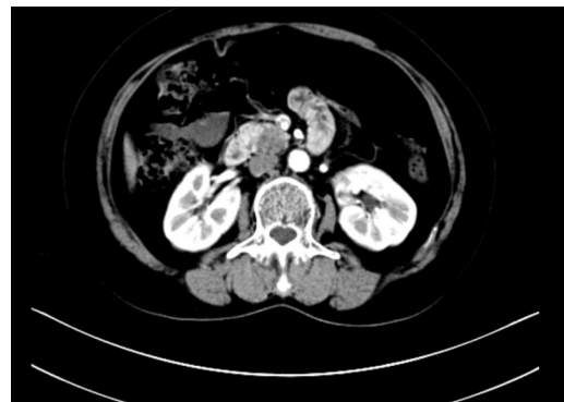
图1 术前增强CT显示胰腺肿瘤

回顾性分析2022年2月—2023年5月四川省医学科学院·四川省人民医院肝胆胰外科8例接受了SILDPPHR+1患者的病历资料, 8例患者平均年龄为(55±14)岁; 男6例, 女2例。所有患者术前均完善相关检查。术前完善增强CT、增强MRI+MRCP及实验室检查诊断为良性病变, 并排除了远处转移, 利用增强CT、MRCP及基于CT的三维重建排除了重要血管及胆总管胰腺段受侵(图1)。术前血常规、肝肾功能、凝血功能、心电图及心脏超声无手术绝对禁忌证。麻醉ASA评分I~II分。在经过评估后, 中心所在多学科团队 (multidisciplinary team, MDT) 得出的结论: 8例患者均为SILDPPHR+1适应对象, 在保留十二指肠的同时可以完成对胰头病变的切除, 告知病患风险与并发症, 患者及家属均知情同意, 进行SILDPPHR+1。本研究经四川省医学科学院·四川省人民医院伦理委员会审批 (批号: 2023年第182号)。