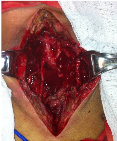
图 2 股动脉结扎加感染性动脉瘤清创

分别与髂动脉和股浅动脉端侧吻合 (图 3-4)。人工血管旁路术后患者口服阿司匹林和氯吡格雷 6 个月。