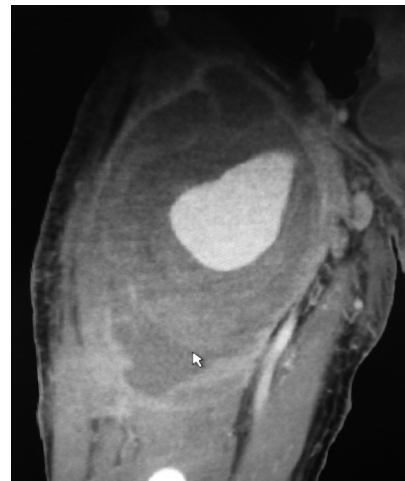
图 1 CT 示股动脉假性动脉瘤

行股动脉结扎及清创术, 二期行经闭孔旁路术; 1 例同期行股动脉结扎清创加患侧髂动脉到股浅动脉人工血管经闭孔旁路术。