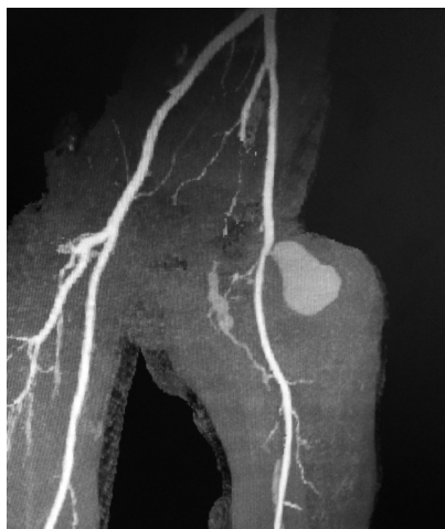
图 5 CT 示假性动脉瘤合并股深动脉闭塞