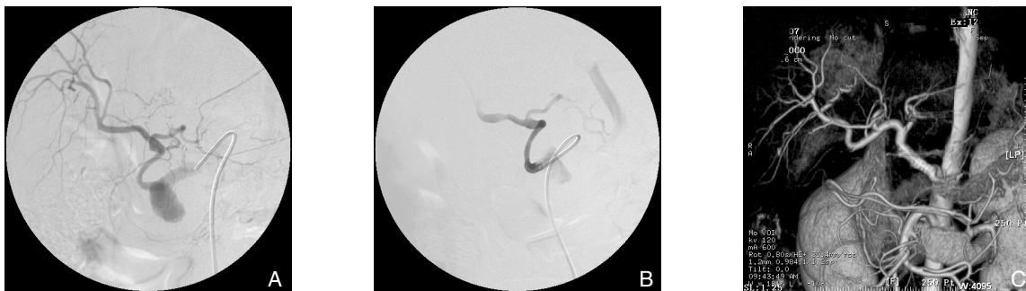
图2 肝移植术后假性动脉瘤形成(47岁女性患者) A: 肝动脉造影证实肝动脉吻合口处假性动脉瘤形成; B: 行覆膜肝动脉支架植入术后复查造影显示假性动脉瘤消失; C: 术后13个月复查CT显示肝动脉通畅, 假性动脉瘤未显影 Figure 2 Pseudoaneurysm formation after liver transplantation (a 47-year old female patient) A: Hepatic arteriography confirming pseudoaneurysm formation of the hepatic artery; B: Arteriography after covered stent placement showing the disappearance of the pseudoaneurysm; C: CTA examination at 13 months after treatment showing patent hepatic artery with no contrast filling of the pseudoaneurysm