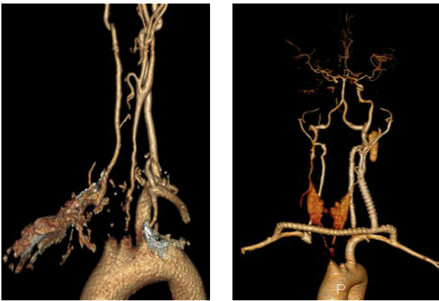
图2 大动脉炎患者双侧颈动脉闭塞，行左锁骨下动脉-左颈动脉-右锁骨下动脉序贯搭桥，术后6个月随访桥血管通畅

9例患者全部获得门诊规律随访，随访时间2个月至3年，平均（ 16 \pm 3 ）个月，以颈动脉超声和/或CTA复查（图2-3），随访期间患者一般情况良好，症状明显改善或消失；1例联合CAS患者术后6个月经超声发现支架近端轻度狭窄（约50%），但患者无自觉症状，未予处理；1例合并冠心病患者术后17个月因心肌梗塞死亡。